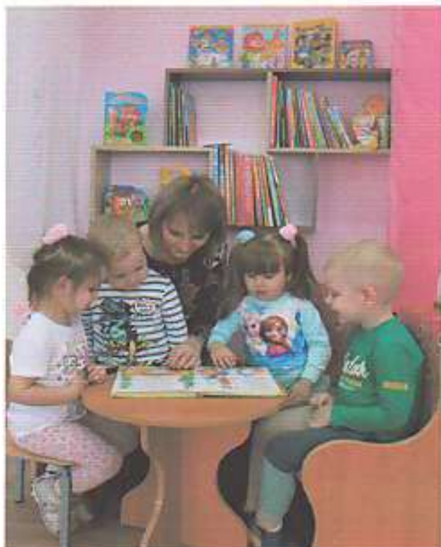
Фото - галерея проекта: